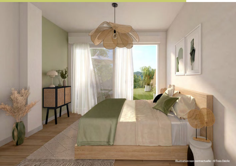
Illustration non contractuelle