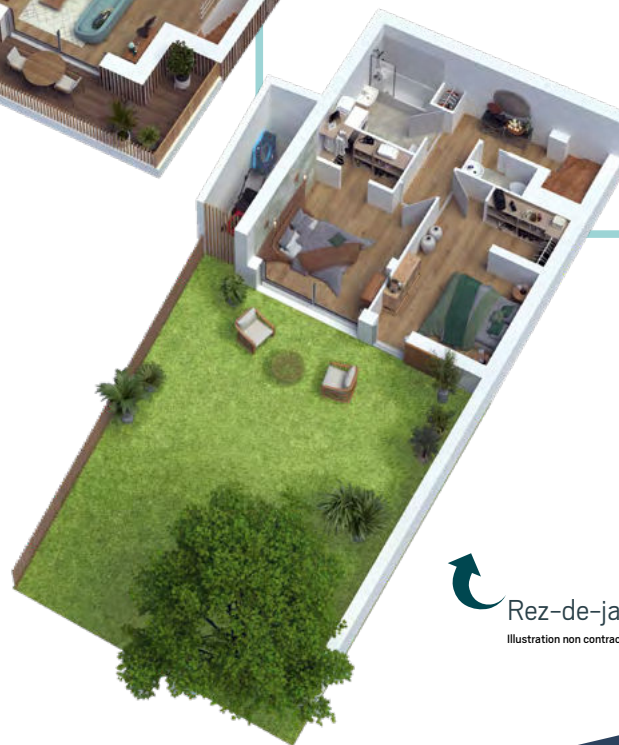
Illustration non contractuelle